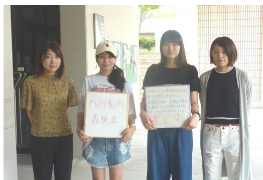
学生による学内での募金活動の様子

また、本学学生は7月10日から学内での募金活動を行ってきたほか、福岡県及び関係団体等が行っている「平成29年九州北部豪雨被災地支援ボランティア」にも参加しています。